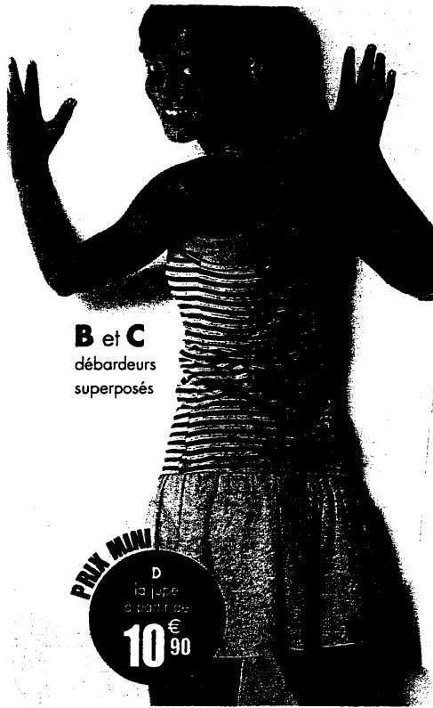
B et C débardeurs superposés