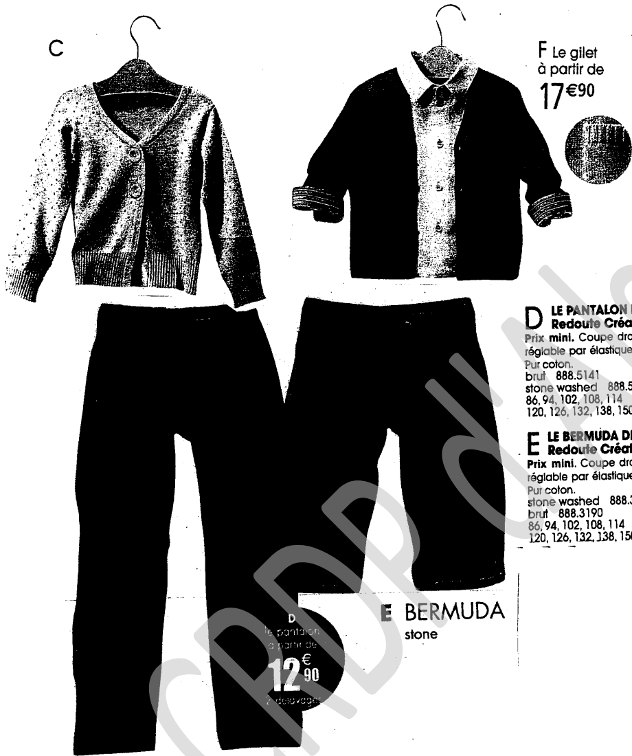
F Le gilet à partir de 17€90